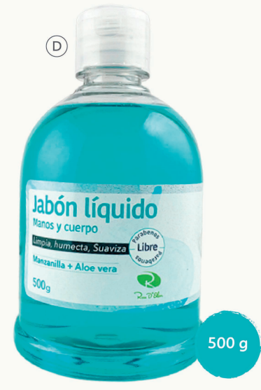
Jabón Líquido x 500 ml (D) 7702789034674 3467