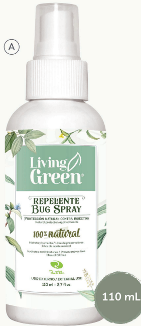
Repelente Bug Spray x 110 ml (A) 7702789029649 2964