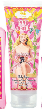
Body Lotion x 220 g B 7702789026419 2641