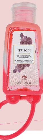
Geles Antibacteriales New York x 24 Und + Pocket Bag x 30 g D 7702789023746 2374