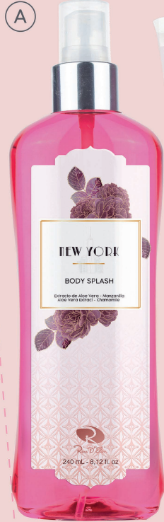
Body Splash x 240 mL A 7702789022763 2276