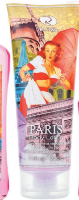
Body Lotion x 220 g B 7702789024125 2412