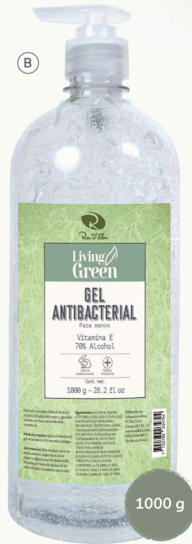
Gel Antibacterial x 1000g (B) 7702789034707 3470

Con aceites especiales que brindan protección segura y efectiva contra los insectos. Al ser aplicado, sentirás una sensación refrescante, humectante e hidratante. No es grasoso. No mancha.