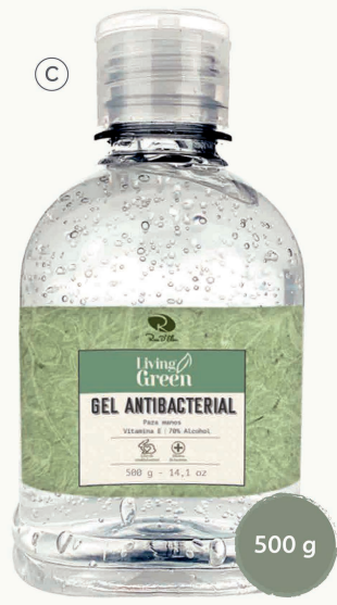
Gel Antibacterial x 500g (C) 7702789034599 3459

Manos limpias, humectadas y perfumadas. Cuida y limpia tus manos sin necesidad de usar agua, toalla o jabón. Rápida absorción. Elimina el 99% de gérmenes y bacterias. Ingredientes principales: vitamina E, aloe vera y 70% alcohol.