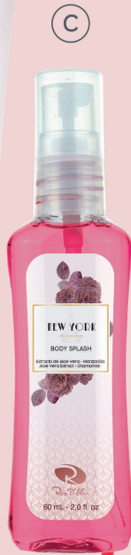
Body Splash x 60 mL C 7702789022794 2279