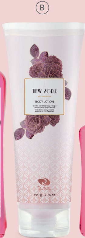
Body Lotion x 220 g B 7702789022770 2277